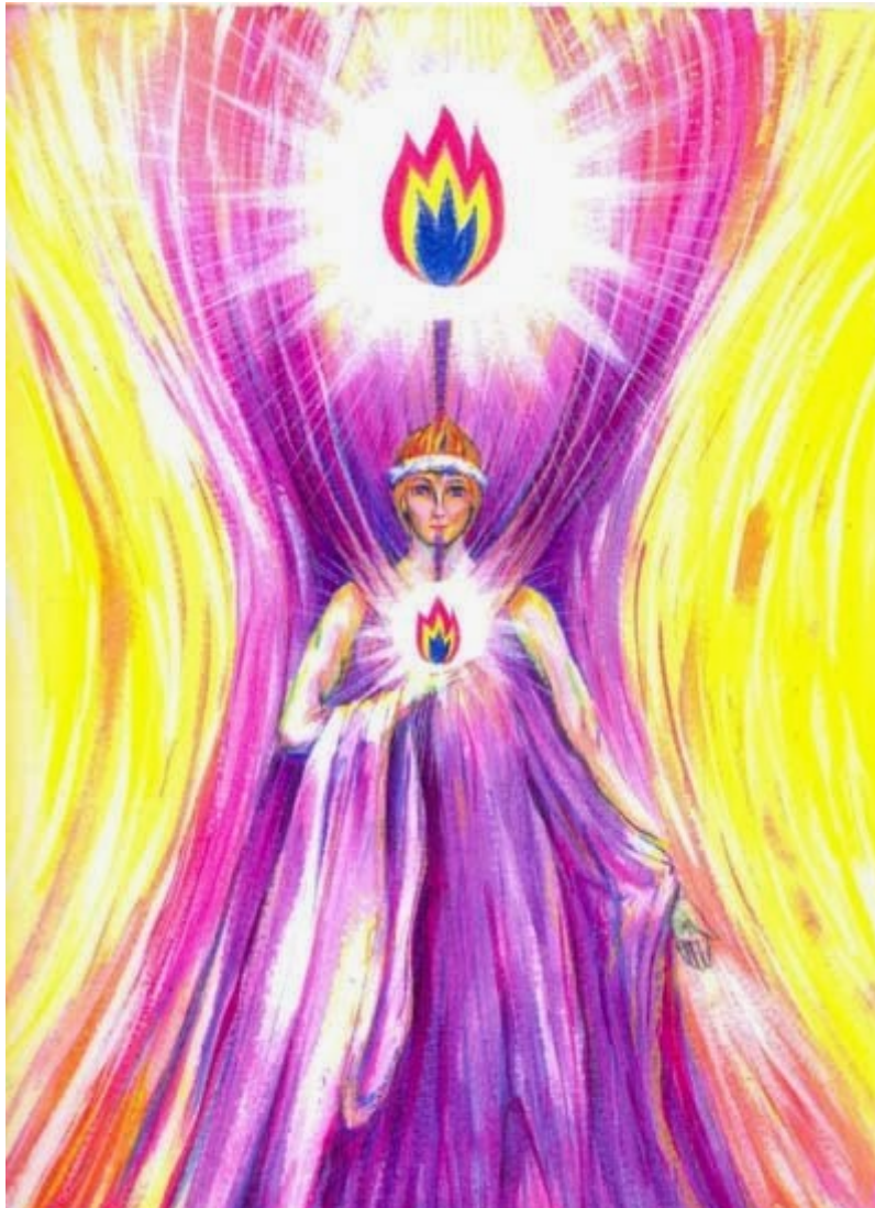
ELOHIM ARCTURUS “YO SOY EL CETRO”

grande que toda la Tierra; luego, a medida que Nos fuimos acercando cada vez más al trabajo de clase, hubieran visto Mi forma – revestida con la misma túnica violeta y la misma corona enjoyada de los Elohim – hacerse más y más pequeña en tamaño, pero no menos potente en poder , eso se los aseguro.