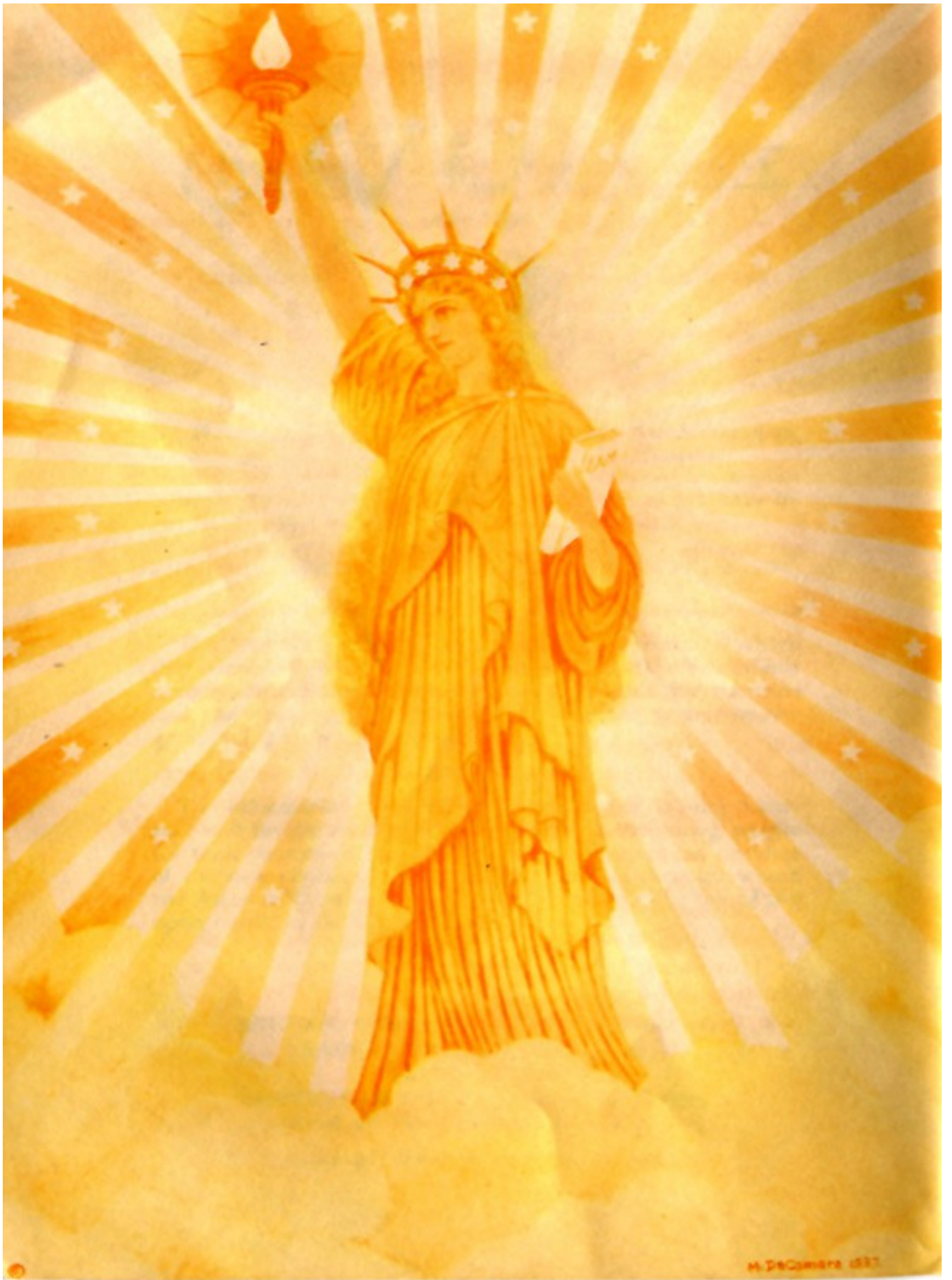
DIOSA DE LA LIBERTAD