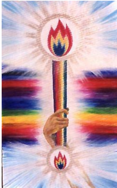
EL CETRO DE ARCTURUS

Al proceder con el siguiente ejercicio, la propia sustancia de las Virtudes de esos diversos Rayos invocada, fluirá desde el Cetro al tiempo que ustedes lo esgrimen, bendiciendo a la Vida que contacta.