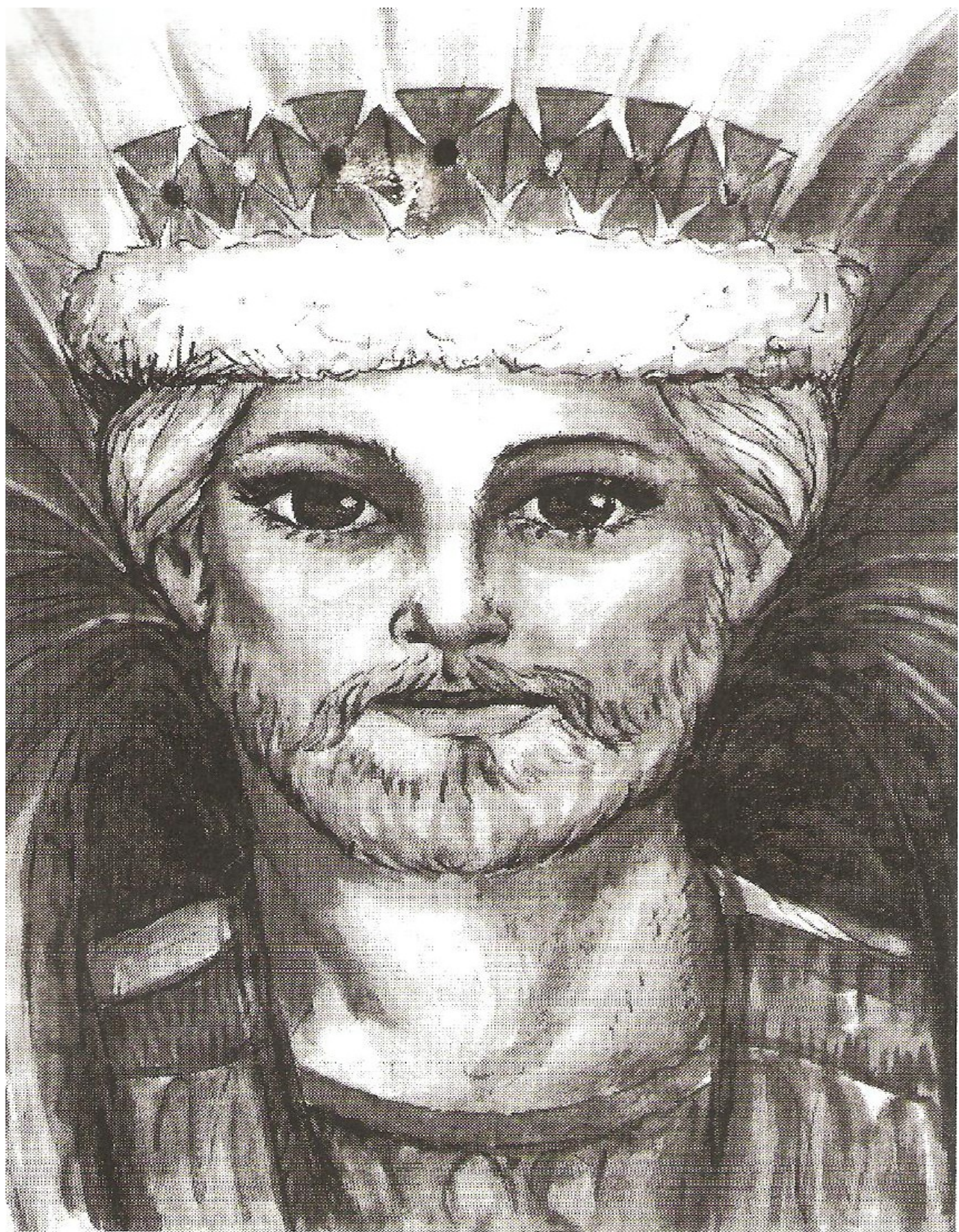
SU MAJESTAD SAINT GERMAIN REY DE LA ERA ACTUAL DE LA LIBERACIÓN ESPIRITUAL