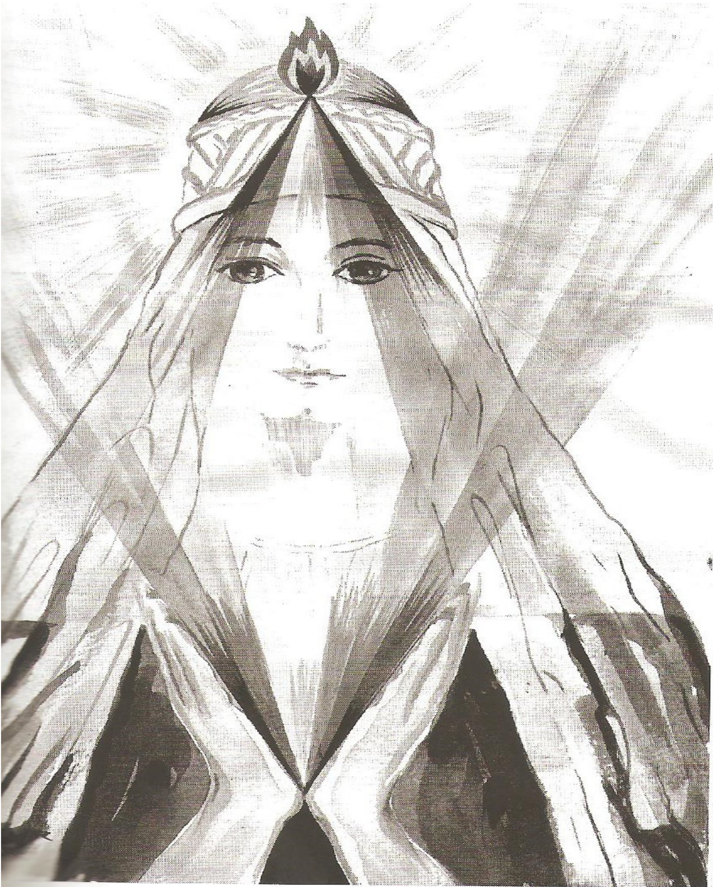
ZARATHUSTRA SACERDOTE CÓSMICO DEL FUEGO SAGRADO