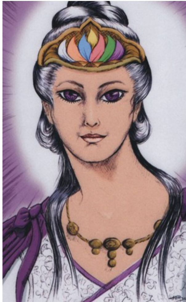
MAESTRA ASCENDIDA LADY KWAN-YIN

(Amable lector: Conscientemente acepta la bendición anterior como invocada para ti también)