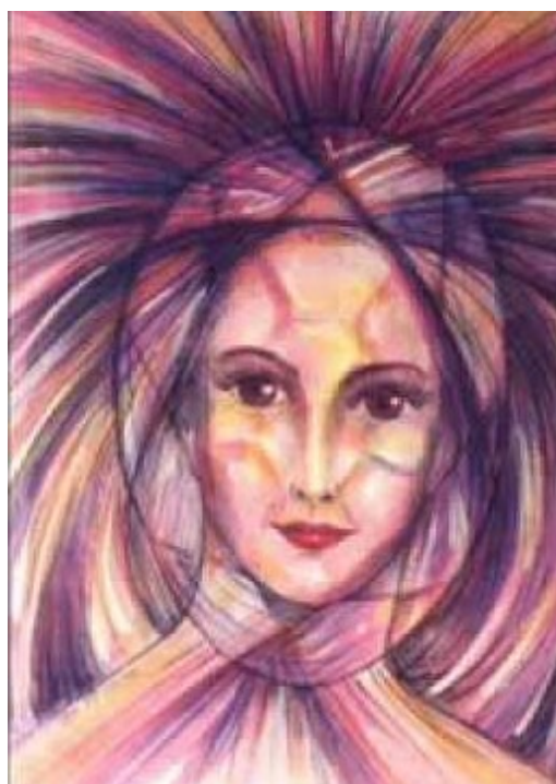
LA SANTA AMATISTA

[Tomado de “ AMISTAD CON LOS DIOSES ” (Panamá: Serapis Bey Editores S.A. - 1995) pp. 8-9]