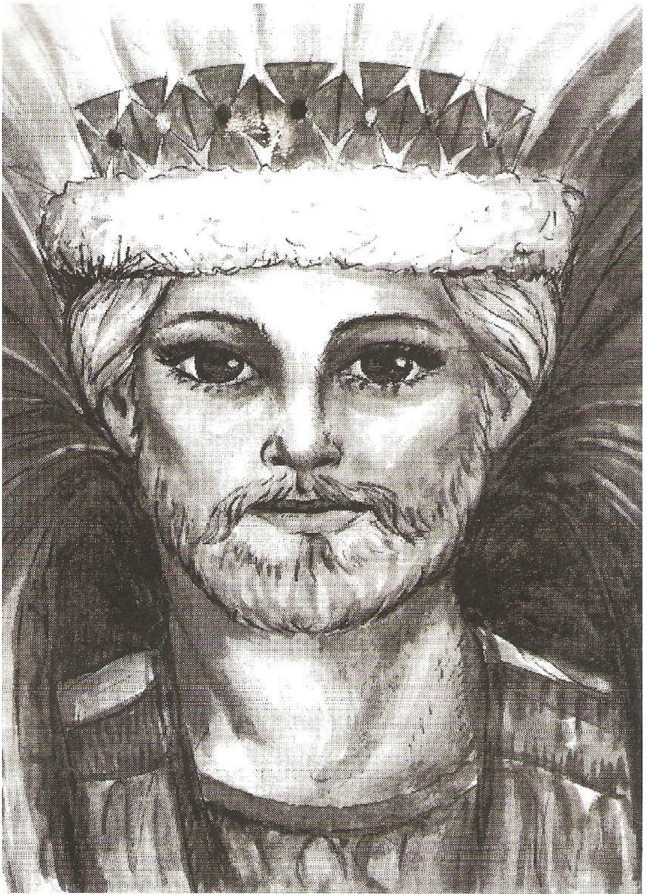
SU MAJESTAD SAINT GERMAIN REY DE LA ERA ACTUAL DE LA LIBERACIÓN ESPIRITUAL