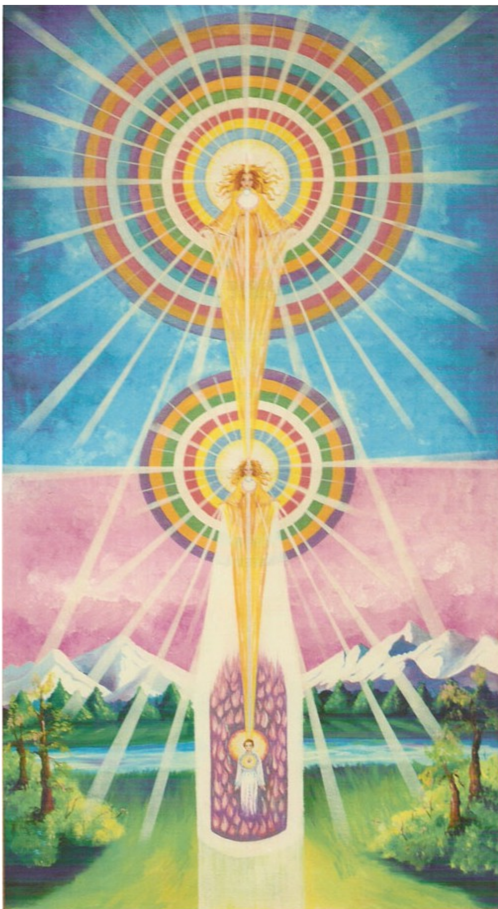
LÁMINA DE LA SANTÍSIMA