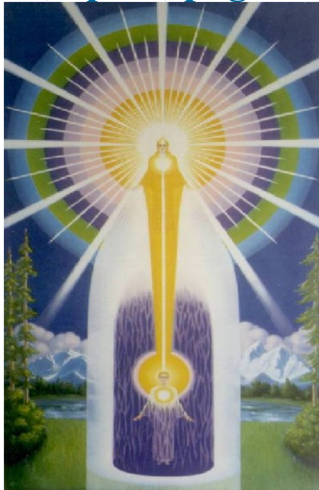
LÁMINA DE LA PRESENCIA “YO SOY”

[Tomado de “ LOS SIETE PODEROSOS ELOHIM HABLAN ”, op.cit, pags. 168]