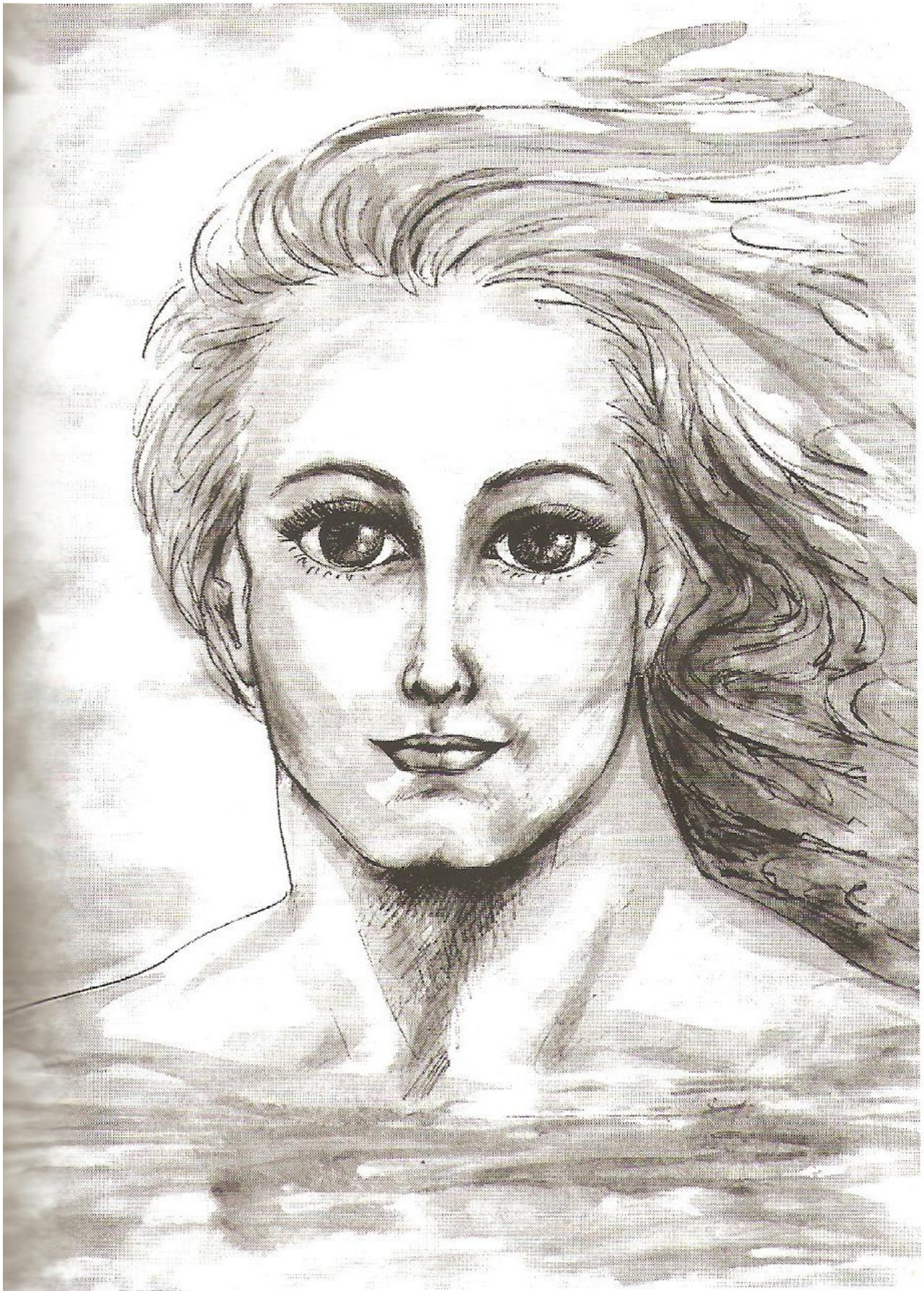
SEÑOR NEPTUNO DIRECTOR DEL ELEMENTO AGUA