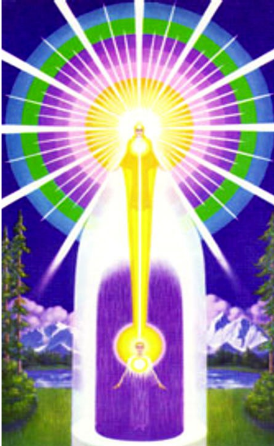
LÁMINA DE LA PRESENCIA DE DIOS “YO SOY” ORIGINAL DEL “I AM ACTIVITY”

Estas son Grandes Leyes de Vida. No son opiniones humanas, sino que se trata de la Ley de Vida que Nosotros, como Seres Ascendidos, ¡sabemos que es Verdad!