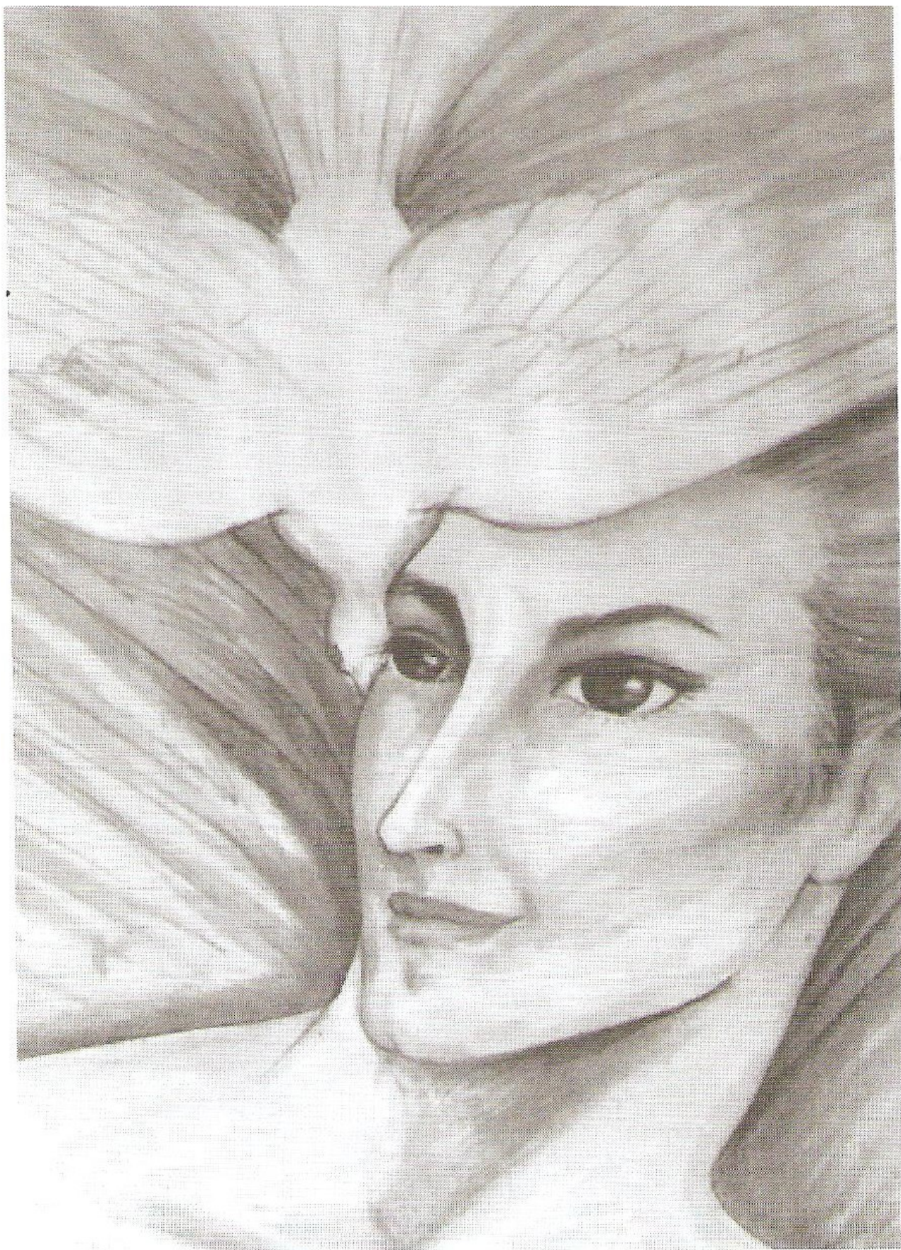
EL MAHÁCHOHÁN DIRECTOR DEL TERCER DEPARTAMENTO DE LA JERARQUÍA PLANETARIA