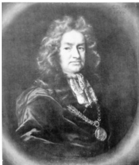
ELIAS ASHMOLE (1617-1692)