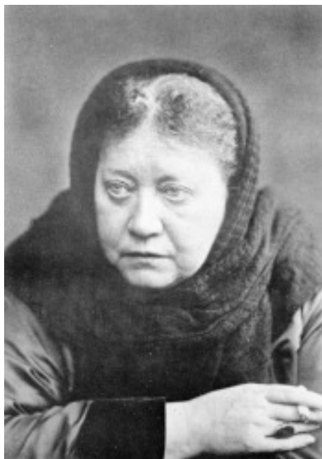
HELENA PETROVNA BLAVATSKY

tienen el derecho de entrar al Nirvana y prefieren renunciar a este estado de beatitud inducidos por una piedad sin límite para el mundo que yace en la ignorancia y sufre, se convierten en Nirmanakayas . Toman la vestidura Sambhogakaya (el cuerpo invisible) a fin de servir a la humanidad, es decir: viven una vida sentiente después de la muerte y sufren mucho al ver las miserias humanas (que no tienen la libertad de aliviar; ya que son, en la mayoría de los casos, Kármicas). Sufren para tener una oportunidad de inspirar a unos pocos con el deseo de aprender la verdad para, entonces, salvarse (Por lo general, todo lo que Schlagintweit y otros han escrito sobre el cuerpo Nirmanakaya es erróneo). Este es el verdadero sentido de la enseñanza Mahayana. El discípulo de la escuela Mahayana, en su discurso a los «Budás (o Bodhisattvas) de la confesión, dice, entre otras cosas, refiriéndose a esta enseñanza secreta: «Creo que no todos los Budas entran al Nirvana». FINAL NOTA). Sin embargo, admitiendo, en gracia al argumento, que de alguna manera fuéramos aptos para servir como sabios ejemplares para el «mundo» y mejorar a la «humanidad», ¿qué podríamos o deberíamos hacer?