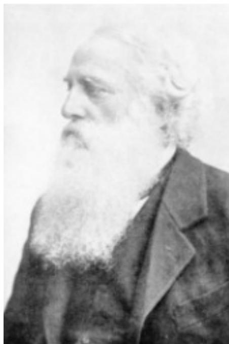
CORONEL HENRY STEEL OLCOTT (1832-1907)

Nuestros bondadosos críticos nos dicen: «¿No les basta que el mundo, a fuerza de ismos haya llegado al Teosofismo , que no es más que una charlatanería trascendental, sin que este último nos ofrezca una versión réchauffé de la magia medieval con su gran Sabbath e historia crónica?».