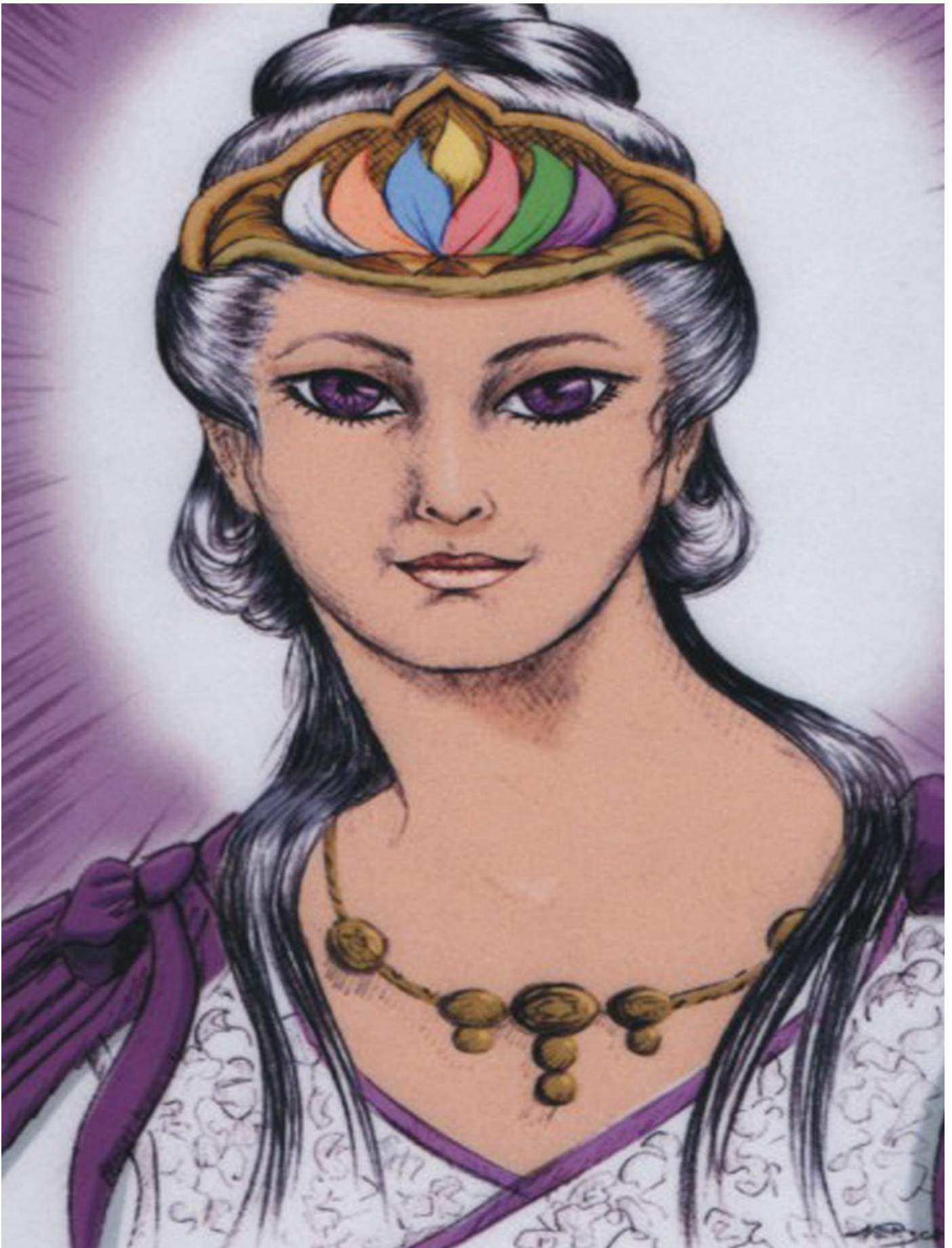
LADY KWAN YIN