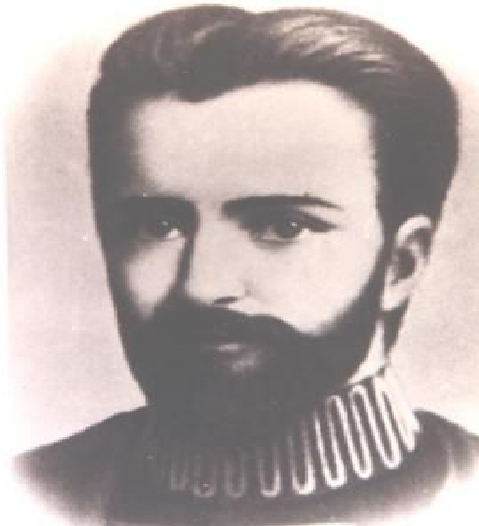
SAINT GERMAIN COMO EL PRÍNCIPE RACKOZI