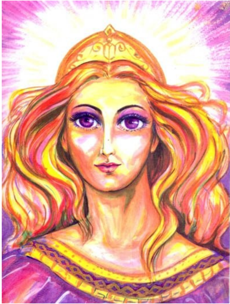
LADY PORTIA DIOSA DE LA JUSTICIA Y LA OPORTUNIDAD